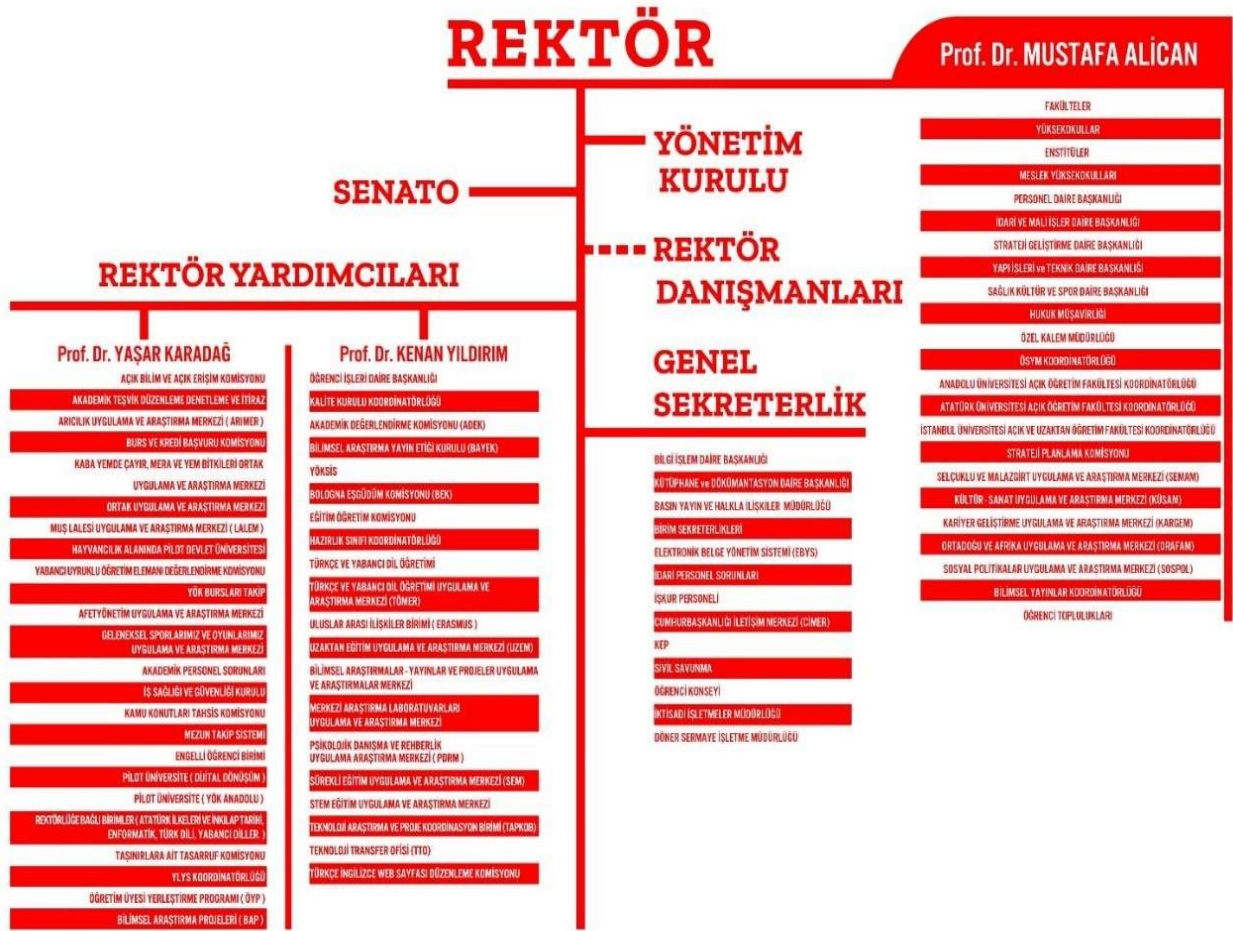
Şekil 1: Üniversite Organizasyon Şeması

Üniversitemiz organizasyon şeması, kurumsal web sayfasında kamuoyu ile paylaşılmaktadır. Muş Alparslan Üniversitesi'nin hiyerarşik yapısını gösteren organizasyon şeması, Şekil 1'de gösterildiği gibidir.